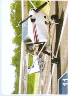
หน่วยเคลื่อนที่เร็ว ทางอากาศ

หากมีผู้ใดสนใจหรือมีข้อสงสัย เกี่ยวกับการกำจัดและความคุม เพลี้ยแป้งสีชมพูในมันสำปะหลัง โปรดติดต่อได้ที่ศูนย์ฯ ต.ห้วยบง อ.ด่านขุนทด จ.นครราชสีมา หรือติดต่อทางโทรศัพท์ได้ที่เบอร์ 088-341-8327, 081-925-0374