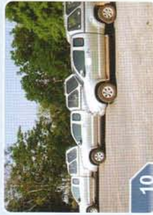
หน่วยเคลื่อนที่เร็ว ทางบก