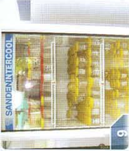
ตู้ควบคุมอุณหภูมิ

ต.ห้วยบง อ.ด่านขุนทด จ.นครราชสีมา โทร. 081-925-0374 โทรสาร.044-249-770 e-mail : huaybong@tapiocathai.org